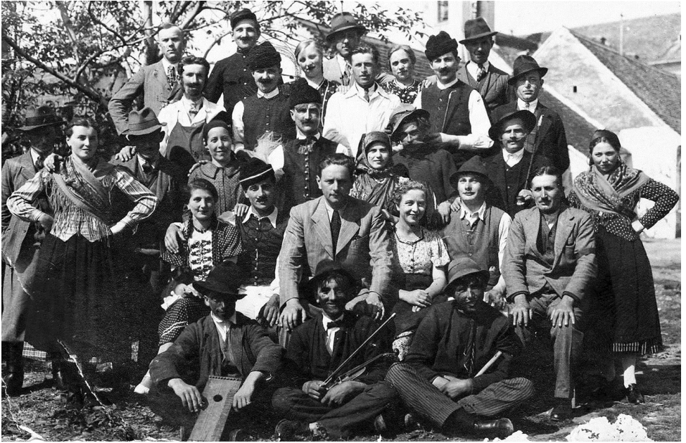
Legnagyobb hatalom—Rábatamási, 1941