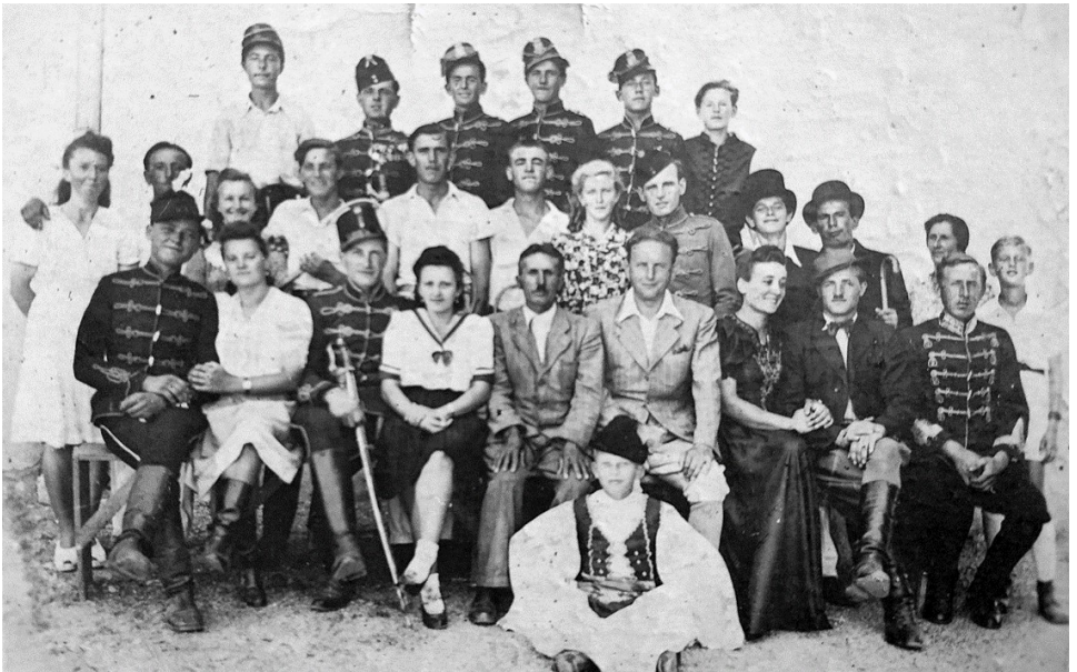
A falurossza c. színdarab szereplői