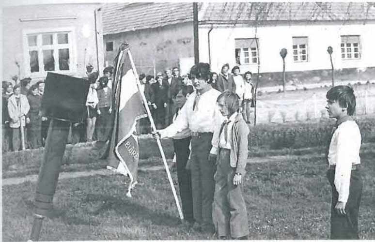
Iskolások ünnepi műsora 1970-es években